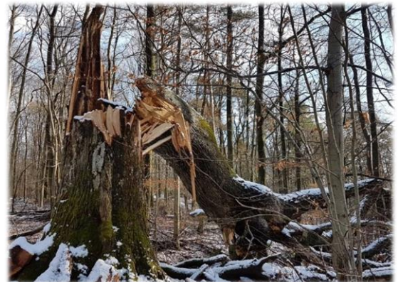
Januar 2018: Das Ende der „Dicken Eiche“ auf Theisbergstegener Gemarkung (siehe Rückseite)